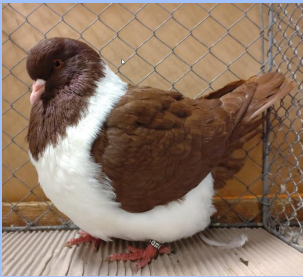
Diplom auf 1.0 rot von Florian Bühler