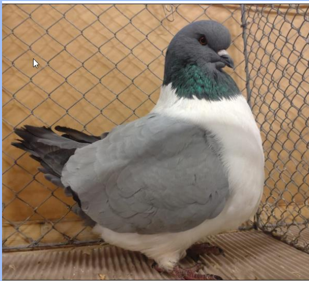
Diplom auf 1.0 blau o. Bi von Stefan Kneißl