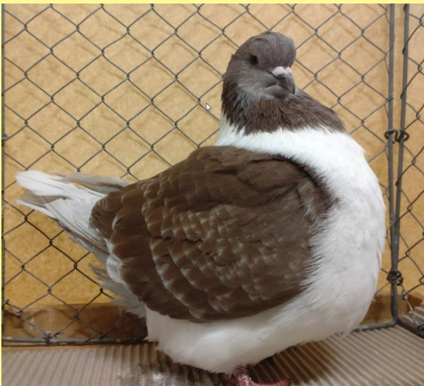
2.Champion auf 1.0 rtfdgeh von Nicolas Kern