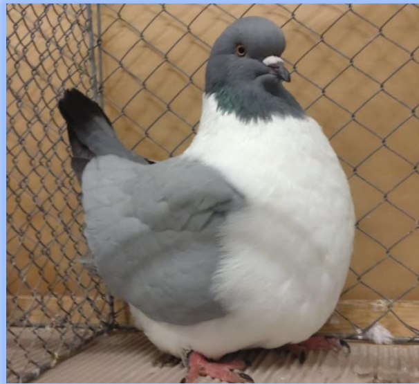
Diplom auf 0.1 blau o. Bi von Stefan Kneißl