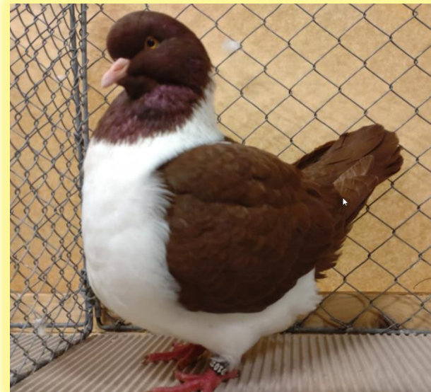
3. Champion auf 0.1 rot von Florian Bühler