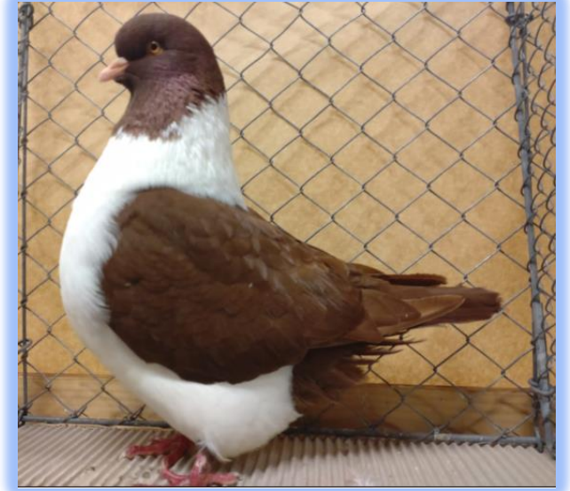
Diplom auf 0.1 rot von Josef Steinbichler