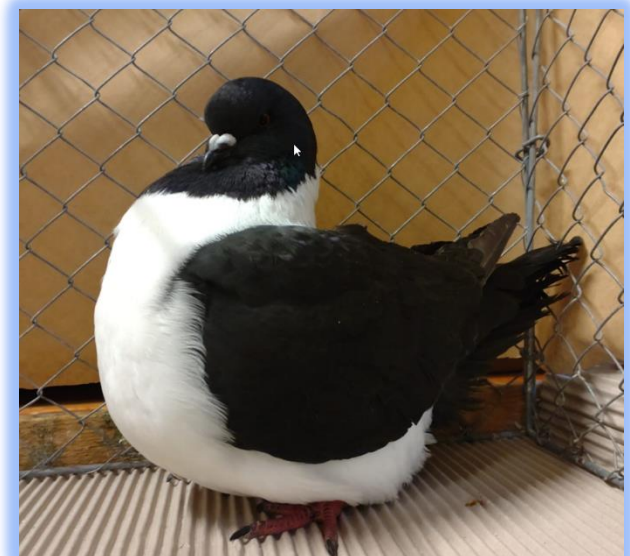
Diplom auf 0.1 schwarz von Hermann Keller