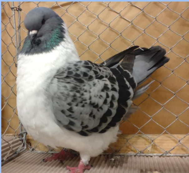
Diplom auf 0.1 blauehämmert von Josef Bayer