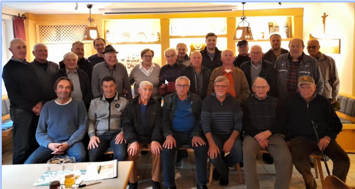
Die Zahlreichen Besucher der Herbstversammlung mit angeschlossener Jungtierbesprechung konnten am 2. Oktober 2022 in Zuchering 68 Strasser vom Jahrgang 2022 die dort zur Schau standen begutachten.