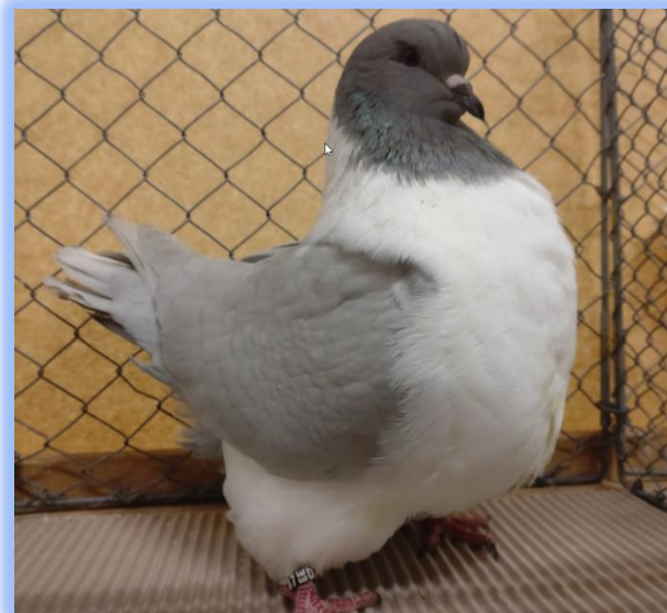
Diplom auf rotfahl o. Bi. von Hermann Kern