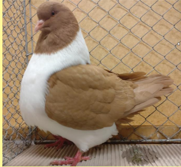
1.Champion auf 0.1 gelb von Rupert Schlittenbauer