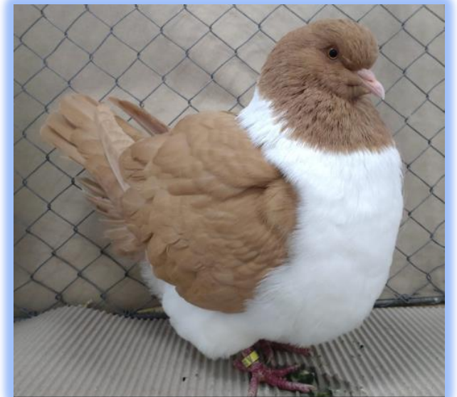
Diplom auf 0.1 gelb von Horst Pauler