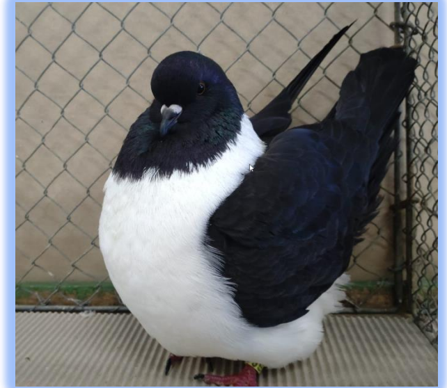
Diplom auf 0.1 schwarz von Florian Bühler