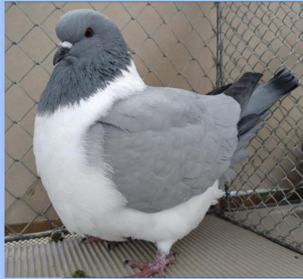
Diplom auf 0.1 blau o. Bi von Dieter Wurster