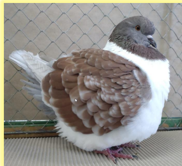
3. Champion 0.1 rotfahlgehämmert von Nicolas Kern