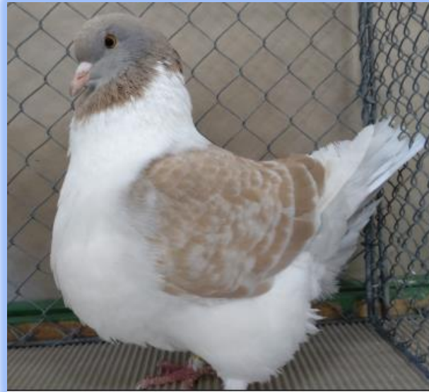
Diplom auf 0.1 gelbfahlgehämmert von Hermann Kern