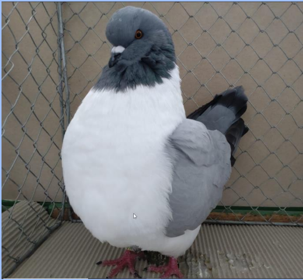
Diplom auf 1.0 blau o. Bi von Hans Stegherr